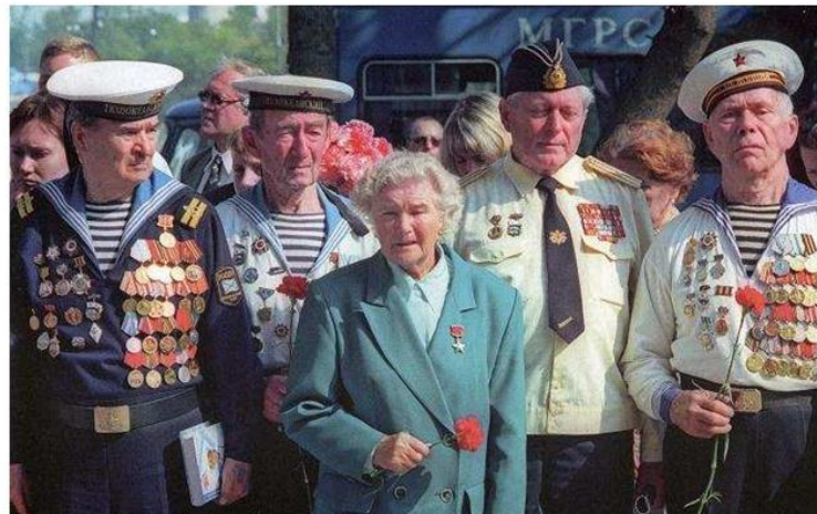
ВETERАНЫ МОРСКОГО ФЛОТА

Прошло очень много времени с той страшной поры, когда напали на нашу страну фашисты. Вспомните добрым словом своих дедов и прадедов, всех тех, кто принёс нам победу. Поклонитесь героям Великой Отечественной войны. Героям великой войны с фашистами